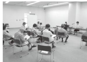
「国立国会図書館歴史的音源を聴く～古閑裕而の世界」の様子