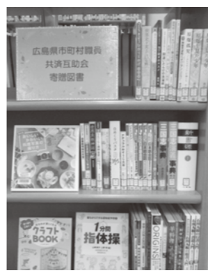
広島県市町村職員共済互助会寄贈本コーナー