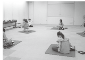
「おひざにだっこのおはなし会」を再開しました。

※本の貸し出しは、1人5冊、2週間です。(3冊から5冊になりました) 今年のクリスマス会は中止です。