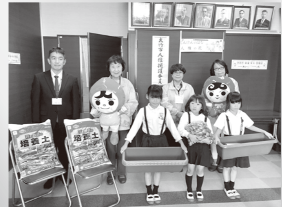
問い合わせ 自治振興課 ☎59-2145

10月7日に人権擁護委員が、大竹小学校を訪問し、チューリップの球根やプランターを贈りました。子どもたちが協力して花を育て咲かせることで、思いやりの心を育ててほしいとの思いで毎年行っている「人権の花運動」ですが、今年は新型コロナウイルス感染拡大防止のため、1年生から代表の3人に贈呈式に出席してもらいました。