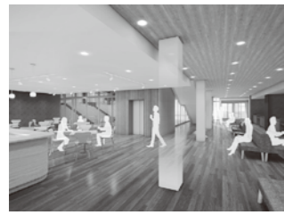
待合・市民スペース

住所 本町1丁目9番3号 開館時間 月～土曜日 8時30分～22時 日曜日 9時～17時 使用時間 月～土曜日 9時～21時30分 日曜日 9時～16時30分 休館日 年末年始（12月29日～1月3日）と祝日