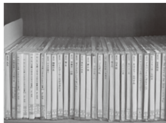
▲マルチメディアDAISYコーナー パソコンで通常の本と同じ文章と絵が画面に表示され、文章が音声で読み上げられます。弱視や学習障害など、活字のみの読書が難しいお子さんの読書の助けになります。