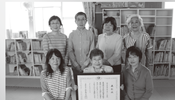
※あいいく館の催しは、26ページに掲載しています。

これは、国民の間に広く子どもの読書活動についての関心と理解を深めるとともに、子どもが積極的に読書活動を行う意欲を高める活動を推進するため、特色ある優れた実践を行っている学校、図書館、団体・個人に対して表彰を行うものです。