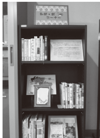
▲和紙や紙についての資料を集めたコーナー