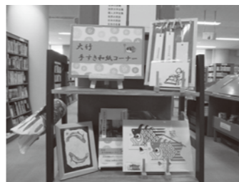
▲和紙グッズのコーナー