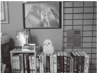
▲作家展示コーナー