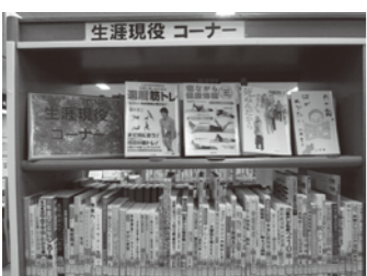
▲生涯現役コーナー