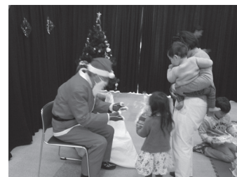
▲おはなし会クリスマススペシャル