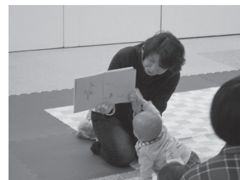
▲親子で楽しむおはなし会