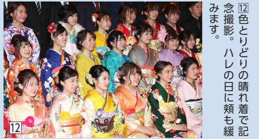
⑫色とりどりの晴れ着で記念撮影。ハレの日に頬も緩みます。