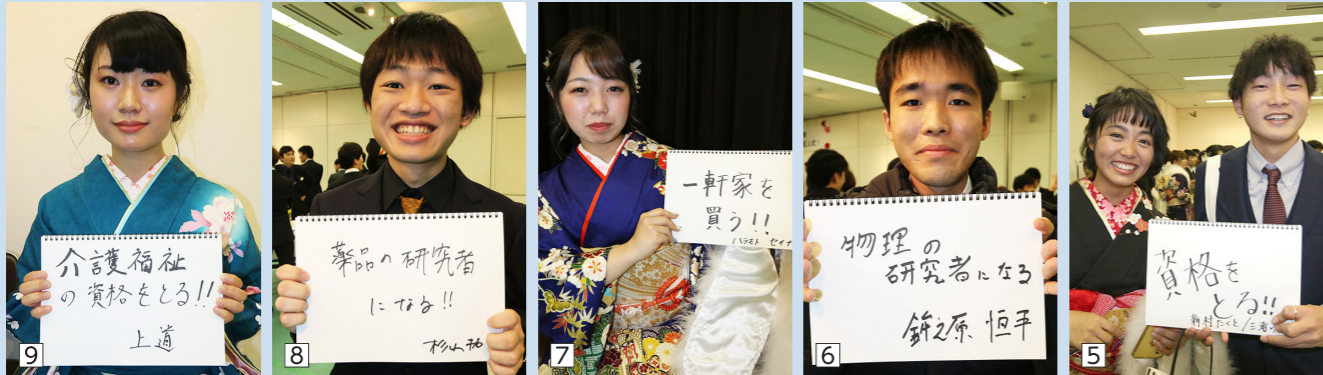
①「大竹中の出身集まれ!」交流会は華やいだ雰囲気。②~⑩新成人の皆さんに聞きました。「あなたの夢、目標は何ですか?」。