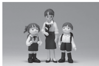
学校選択希望申請結果 (令和元年11月18日現在)