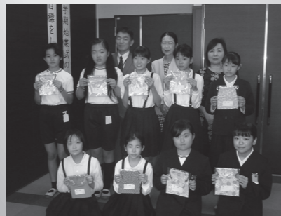
大竹小学校での贈呈式

10月31日、国際ソロプチミスト大竹から、市内の小学校に通う5年生女子に、手作り小物入れ102個を寄付していただきました。ありがとうございました。