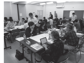
10月27日に行われた第1回ワークショップ

とき 12月15日(日)14時～16時 ところ 総合市民会館 対象 市内在住または通勤・通学の18歳以上の方 ※第1回に参加していない方も参加できます。 内容 西口交流広場案に対する意見交換など 申し込み 12月10日(火)までに必要事