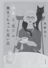
「作家」と「魔女」の 集まっちゃった思い出 角野 栄子/著 (KADOKAWA)