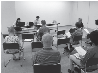
▲「懐かしい唄で世界一周～国立国会図書館歴史的音源を聴く」の様子

親子で楽しむおはなし会 とき12月13日(金)11時～ ▼ところ 図書館2階ギャラリ1-1 ▼対象 1歳から おはなし会スペシャル クリスマスマス会 とき12月21日(土)11時～ ▼ところ 図書館2階ギャラリ1-1 ▼対象 幼児・小学生 展示コーナー 一般向き マイホームタウン(帰省)クリスマス 児童向き クリスマスマス 時事コーナー 年末年始お助け本&来年もよろしく子(ね)!