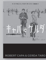
「キャパとゲルダ ふたりの戦場カメラマン」 マーク・アロンソン/著 マリナ・ブドーズ/著 原田勝/訳 (あすなろ書房)