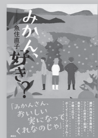
「みかん、好き?」 魚住 直子/著 (講談社)