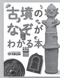
「古墳のなぞがわかる本」 河野 正訓/監修 (岩崎書店)