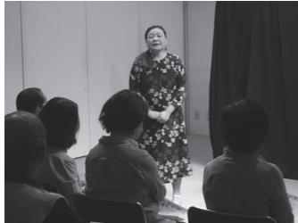
▲「おはなしきかせて～大人のためのストーリーテリングのおはなし会」の様子