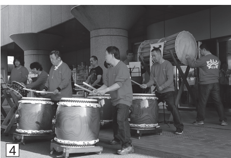
fのついているものは、これ以外の写真も大竹市公式フェイスブックで見ることができます。