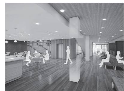
待合・市民スペース