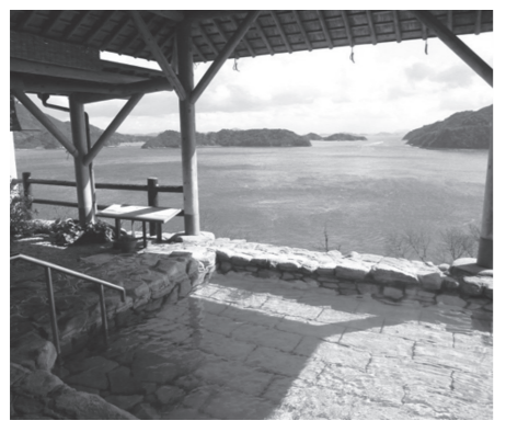
きのえ温泉で、ゆったり瀬戸内の島々を眺めます。

とき 12月8日(日) 8時30分~18時30分 集合・解散場所 広島駅新幹線口 内容 さのえ温泉清風館での入浴・屋食の後、みかん狩り、最後は竹原の町並みを散策。 定員 40人(申込順) ※最少催行人数30人 参加料 8千円(交通費、昼食代込み) 申し込み 11月15日(金)から広交観光株式会社へ。