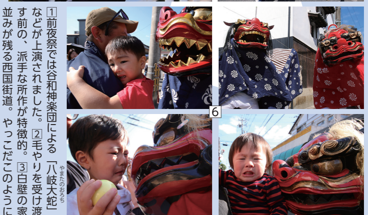
⑥おれたち赤獅子、青獅子コンビ。子どもたちをガブリ!

⑦交差点などの要所で右に左に、あわや家に飛び込む勢いで練ります。⑧2.1mのJRガードをくぐるため、みこしの屋根のホウオウをいったん外します。⑨造り酒屋の面影を残す蔵の前をみこしが練り歩きます。