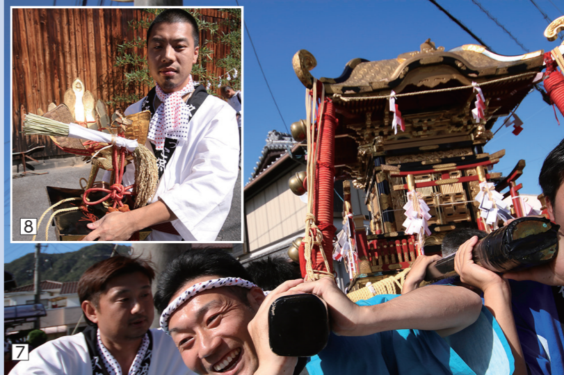
f のついているものは、これ以外の写真も大竹市公式フェイスブックで見ることができます。