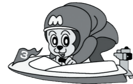
パルボート宮島 (外向発売所) ほぼ年中無休で営業中!!