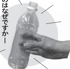
▲リサイクルしやすいようにするため、ラベルをはがしてください。