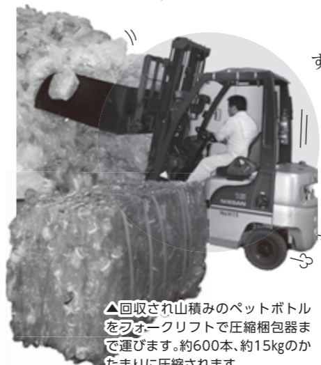
▲回収され山積みされたペットボトルをフォークリフトで圧縮梱包器まで運びます。約600本、約15kgのたまりに圧縮されます。