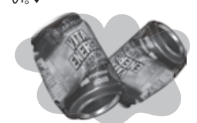
袋の中にはペットボトル以外のプラスチック容器や缶が混入していることも。ペットボトル識別表示を確認してください。