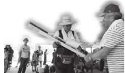
釣りざおやカープ観戦チケットなどの賞品もいっぱい。(昨年の大会)