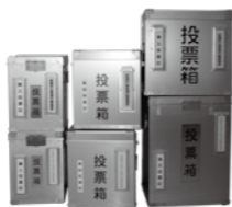
▲出番を待つ、各投票所の投票箱。

投票の際は、このはがきを忘れずにお持ちください。 なお、市内転居等の住所整理は7月11日現在で行います。7月12日以降に市内転居をした方には、旧住所宛てに郵送しますので、旧住所の投票所で投票してください。 ※投票所入場券(はがき)は、紛失などされた場合でも、投票できます。