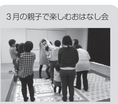
3月の親子で楽しむおはなし会