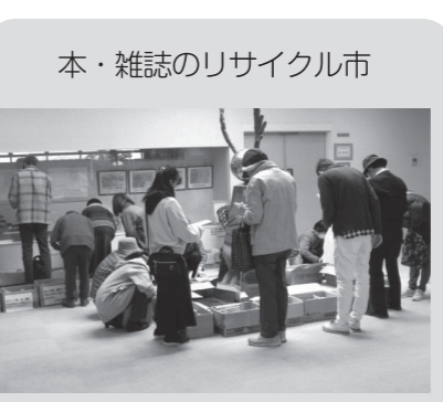
本・雑誌のリサイクル市

とき 5月18日(土) 11時～ ところ 図書館1階 おはなしの部屋 対象 幼児・小学生