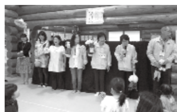
こども館で人権擁護委員が人形劇「大きなかぶ」を演じた。