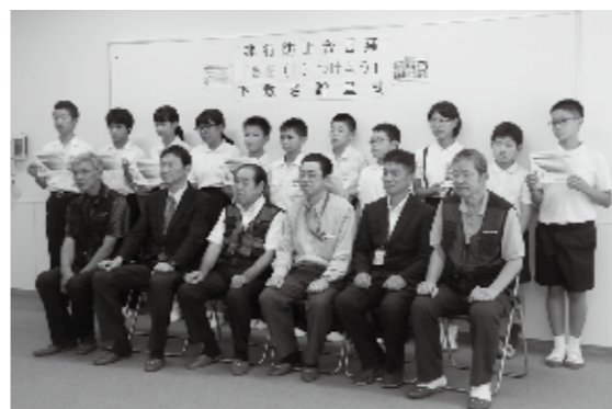
安全で楽しい夏休みを送れるようにと、下敷きが贈られた。