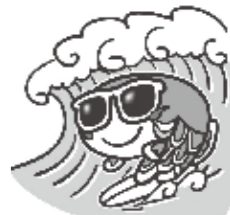
「おおたけ」PRキャラクター コイちゃん