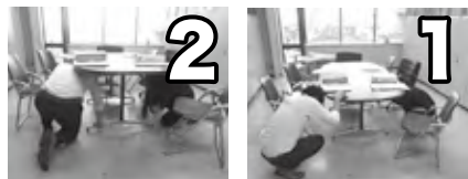
(1) 姿勢を低くして(しゃがむ) (2) 体や頭を守って(かくれる)

「大地震です」 訓練放送を合図に安全行動を。 問い合わせ 総務課 ☎2119 この訓練は、防災行政無線で緊急地震速報を放送し、地震が発生した時に直ちに身の安全を守る行動がとれるように、県内一斉に「安全行動1・2・3」を行うものです。 1～3分間程度でできる訓練ですのでぜひ参加しましょう。 放送内容 緊急地震速報チャイム↓「緊急地震速報。大地震です。これは訓練放送です。」(3回繰り返し) とき 7月5日(木) 10時から1～3分程度