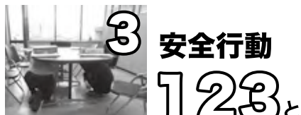
(3) 揺れが収まるまでじっとする(まつ)