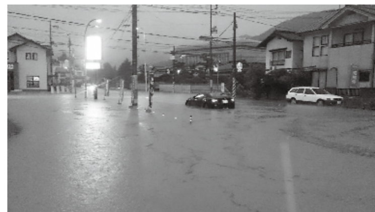
平成26年8月6日の豪雨で浸水した本町1丁目周辺。

日本列島を揺るがす地震。襲い来るゲリラ豪雨。自然災害や人的な災害、そして事故に、いつ遭遇しても不思議ではありません。穏やかな日常が、突如悲惨な非日常になってしまう私たちの暮らし。私たちに忍び寄る危機は、今そこにあるのかもしれない。しかし、自分の身を守るための知識を身につけ、情報に触れることで、危機的な状況を避けることもできます。今そこにある危機から身を守るための情報をお届けします。(6～11ページ)