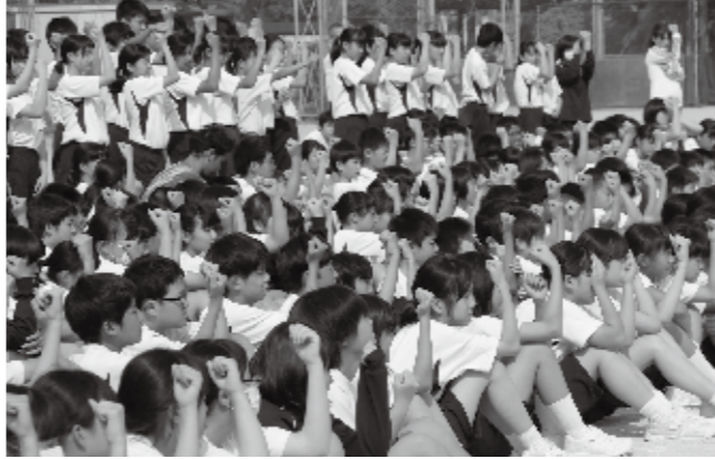
(右) 自転車と自動車の出会いがしらの衝突。スタントマンの体はボンネットに叩きつけられた。(左) 自動車の運転席から、左斜め後ろは死角となる。目の前に腕を立てて死角を確かめる生徒たち。