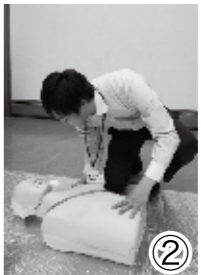
② 「どうしましたか」「大丈夫ですか」と声をかけ安全確認する。