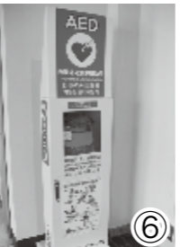
⑥ AEDは公共施設などに設置されているので、位置をチェックしておこう。