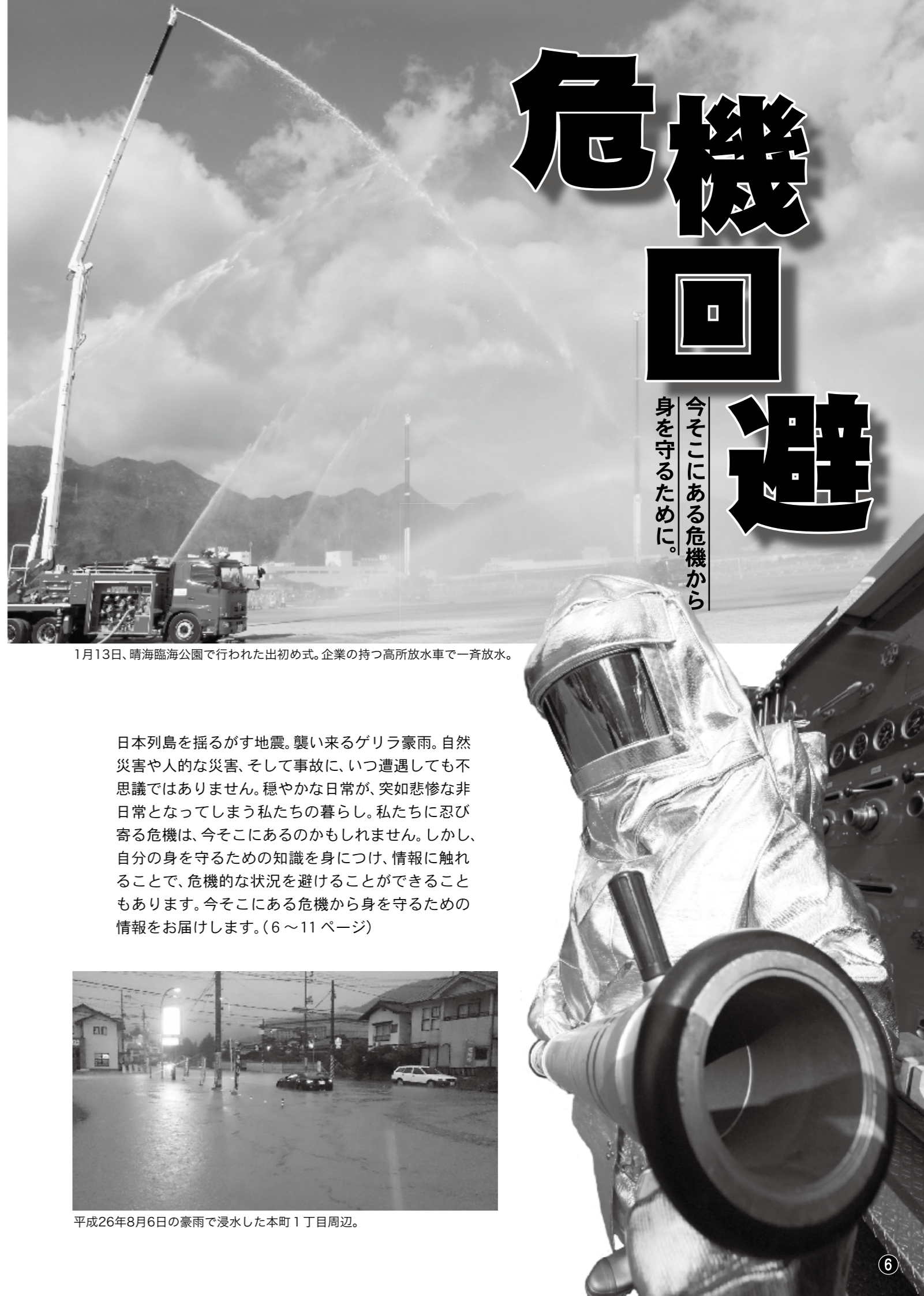
1月13日、晴海臨海公園で行われた出初め式。企業の持つ高所放水車で一斉放水。

日本列島を揺るがす地震。襲い来るゲリラ豪雨。自然災害や人的な災害、そして事故に、いつ遭遇しても不思議ではありません。穏やかな日常が、突如悲惨な非日常になってしまう私たちの暮らし。私たちに忍び寄る危機は、今そこにあるのかもしれない。しかし、自分の身を守るための知識を身につけ、情報に触れることで、危機的な状況を避けることもできます。今そこにある危機から身を守るための情報をお届けします。(6～11ページ)