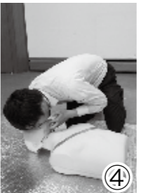
④ 指であごを持ち上げ気道の確保。正常な息をしているか確認。息がなければ気道確保して鼻をつまんで人工呼吸。