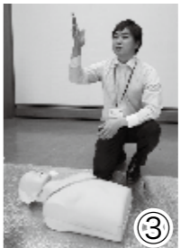
③ 周囲の人に「119番通報してください」「AEDがあれば持ってきてください」と要請。人がいない場合は、まず119番。