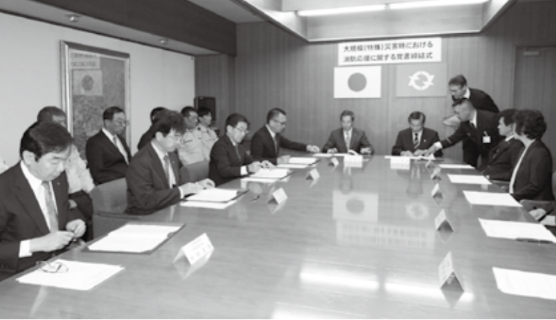
締結事業所は 株式会社大竹工場、三菱ケミカル株式会社大竹事業所、三井化学株式会社大竹工場、日本製紙株式会社大竹工場、大竹明新化学株式会社