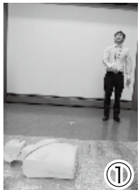
① 路上に人が倒れているぞ！近寄るときは周囲の安全を確認する。