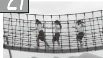
(右)つり橋はちょっと緊張。 (上)在日米軍再編交付金を使ってできた遊具のテープカット。 (下)空中を歩くようなつり橋。 (左下)ロープのトンネルは無重力状態みたい？