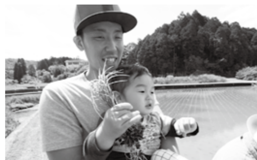
(上)5月の空を映した田んぼに集合。(下)お米の赤ちゃんをしっかりと握っています。(左)お母さんの背中にしっかりとつかまっています。