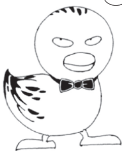
正義の味方 ひっかからないカモ

みんなの気づきで悪質商法から 高齢者を守りましょう！ どんな小さなことでもひとりで悩まず、 消費生活センターにお気軽に ご相談ください。