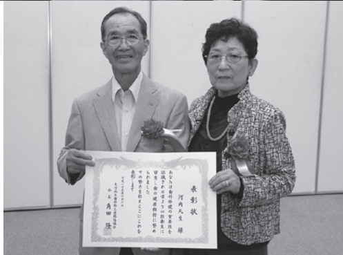
二人そろって表彰