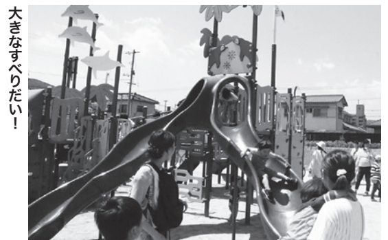
大きなすべりだい！