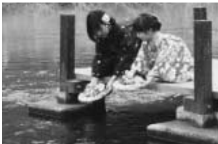
(右) 川面にそっと置かれた流しびな。手作りでどれも色とりどりに飾られているよ♪

おおたけのまちの普段は気づかない魅力を紹介するコーナー。今回は、おおたけの春の伝統行事「ひな流し」を紹介するよ♪