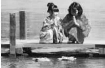
(左) ゆっくりと川を下る流しびなに手を合わせる子ども達♪どんな願いを込めたのかな？