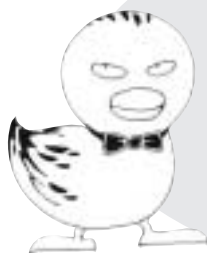
消費生活センターキャラクター 正義の味方 ひっかからないカモ