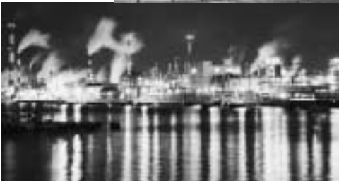
(左) 対岸から見る工場夜景。海面に光が反射して、幻想的な雰囲気はデートにもぴったり♪

市ホームページトップ →大竹市の魅力いっぱい →観光みどころスポット →大竹市の工場夜景 (工場萌え)