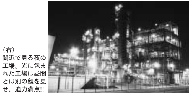
(右) 間近で見る夜の工場。光に包まれた工場は昼間とは別の顔を見せ、迫力満点!!