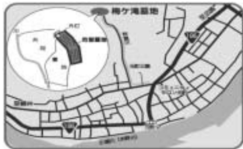
梅ヶ滝墓地位置図