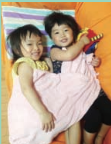
これからますます仲良しでいようね☆