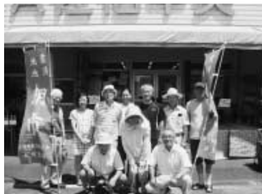
地元生産者の皆さん

朝市以外にも、月々土曜日(祝日を除く)8時30分から店内で地元野菜や加工品を販売しています。