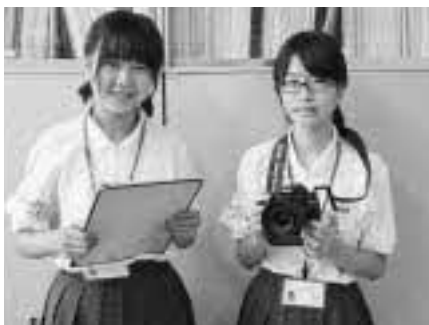
矢野さん（左）と向さん（右）

2人は同級生が職場体験している様子を記事にしようとして、立戸保育所を訪れ、同級生や