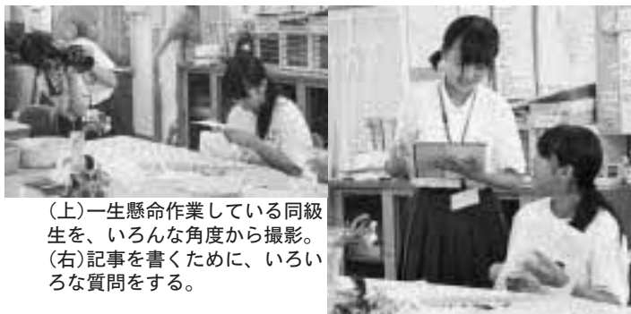
(上)一生懸命作業している同級生を、いろんな角度から撮影。 (右)記事を書くために、いろいろな質問をする。

子供にインタビューをしたり、写真を撮ったりしました。そして市役所に戻った後、パソコンを使って記事を作る模擬体験をしました。「文章を書くのが難しかった」と話しながらも、「写真と文章をうまく使った、素敵な記事を作っていました」。