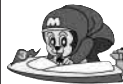
ボートレース宮島マスコットキャラクター「モンタ」