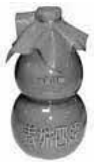
「洞天乳酒」。種類によってアルコール度数や風味が異なる。

世界で最も古い酒造りの歴史を持つとされる中国。都江堰市にも、千年の歴史を持つ「洞天乳酒」という有名なお酒があります。四川省が原産地とされる果物のキウイと青城山の天然水を使い、道教の伝統的な技法で製造したお酒で、ひょうたん型の瓶に入っているのが特徴です。