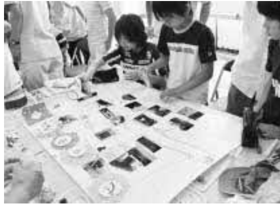
自分たちが見つけた場所を、自分たちでマップに掲載していきました。

大竹青年会議所は、昨年度から市内6つの小学校区を対象に防犯に特化した「安心安全マップづくり」に取り組んでいます。 このマップは、「入りやすく、見えにくい場所」をキーワードに、子どもたちと一緒にまちを歩き、子どもの目線で危険な場所を発見し、掲載するものです。