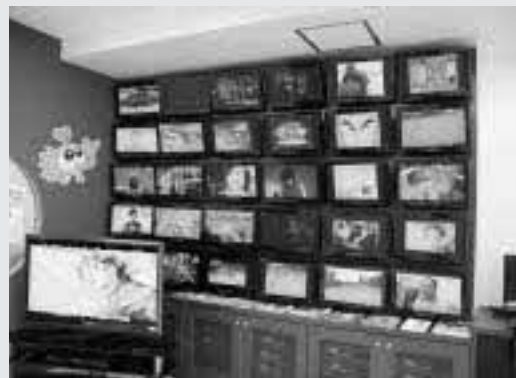
ケーブルテレビに加入すると、多くの番組を視聴できます。

平成22年末から市内でサービスが開始したケーブルテレビでは、ケーブル中継、時代劇などの多チャンネル放送や市内の催しなどを伝える地元情報番組、1ギガ高速インターネットなどの利用ができます。また、市議会の中継も視聴することができます。 この度、このケーブルテレビに新規に加入する方へ、初期費用の一部を補助する制度ができました。対象となるのは、住宅を新築して市外から転入された世帯、または市内で新たに住宅を新築する世帯で、ケーブルテレビに新規加入する場合です。