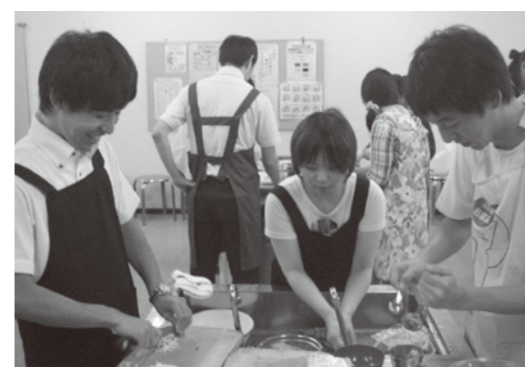
楽しみながら料理の腕が上達します。

毎月第3火曜日に開催しています。男性も料理初心者も、先生が楽しく丁寧に教えてくれるので、ぜひ一度来てみてください。きっとすぐに料理の腕が上達します。参加費は参加した月だけ払うので、毎回参加できるかどうか不安な方も、大丈夫です。