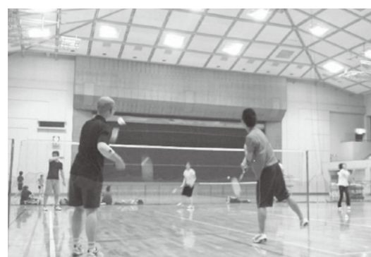
初めてでもすぐに楽しめます。

初心者18人で、毎週木曜日に大竹中学校で活動しています。ラケットの持ち方や振り方などから、講師の方が丁寧に指導してくれるので、初心者でもどんどん上達します。しかも、初心者に合わせて活動しているので今から参加しても大丈夫。新しいメンバー大歓迎な雰囲気なので、一人で来てもすぐに打ち解けられます。最初は上手くいかなくても、イメージ通りにシャトルが飛んだ時は最高に気持ちいいですよ。バドミントンやってみようかなって人も、単純に同世代の友達増やしたい人も、バドミントンサークルで、一緒に楽しい時間を過ごしませんか?