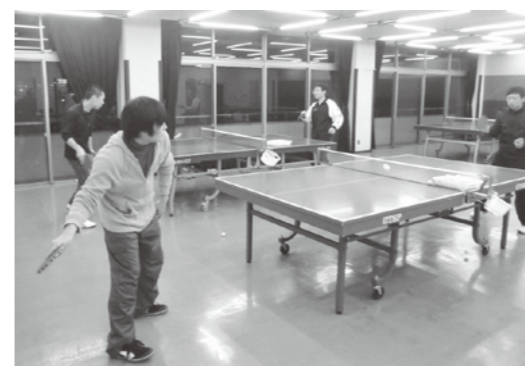
楽しく活動中です。

卓球サークルは、毎週水曜日に活動しています。メンバーの半分は初心者で、仲良く楽しく活動しています。また、親睦会なども積極的に開催しています。卓球は、今から始めてもどんどん上手になれるスポーツです。ぜひ気軽に、参加してみてください。