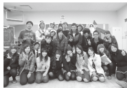
クリスマスパーティー

ミッキークラブは、さまざまなイベントを企画するサークルです。これまで、ドッジボール大会やクリスマスパーティーなどを企画、開催してきました。苦勞も多いけれど、参加者の笑顔が何よりのご褒美です。一緒に、楽しいイベントを作りましょう。