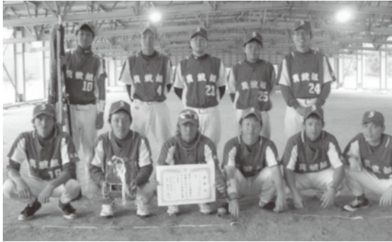
11人で優勝を勝ち取った真戦組

7月23日から24日にかけて、庄原市の口和総合運動公園で行われた第44回中国五県軟式野球二部広島県決勝大会。市内で活動する軟式野球チーム「真戦組」が9試合を勝ち抜き、見事優勝しました。真戦組は、宮島工業高校野球部OBを中心に結成された社会人チームで、毎週日曜日に練習を行っています。「11人しかないメンバーそれぞれが別な仕事をしており、なかなか練習時間がとれない中、がんばって