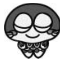
平成26・27年度 運営状況

利用者の増加に伴い、車内が混雑することが多くなりました。混雑時には下記の注意事項に留意してご利用ください。