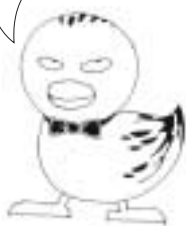
消費生活センターキャラクター 正義の味方、ひっかからないカモ

一人で悩まないで！ 地域のみんなで解決しましょう。 周りに困っている人がいたら、 消費生活センターを 紹介してください。