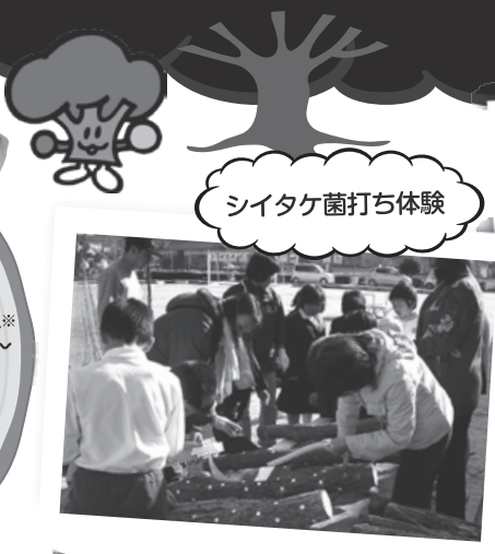
シイタケ菌打ち体験

ひろしまの森づくり県民税とは 豊かな森林を県民全体で守り育てるため、県民や企業のみなさまに広くご負担をお願いし、人工林対策や里山づくりなど「ひろしまの森づくり事業」を展開しています。