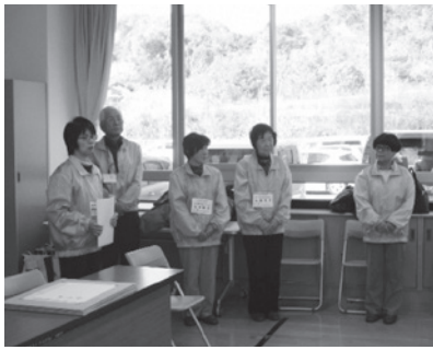
人権擁護委員の方々

人権擁護委員の主な活動は、人権に関する相談に応じることですが、人権を守るためのさまざまな啓発活動も行っています。 毎年、大竹・和木川まつり花火大会で、啓発物を配布しています。その他、子どもたちに人権を考え、感じてもらうために、保育所や幼稚園、小学校で紙芝居を行ったり、小学校に人権の花を配布したりしています。