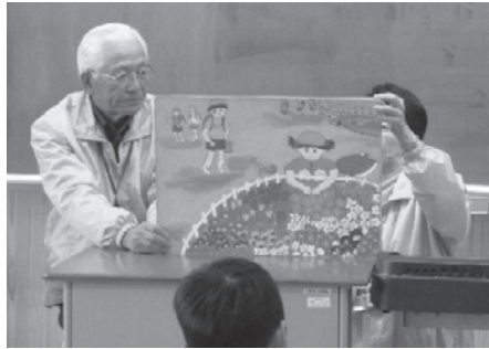
小学校での紙芝居