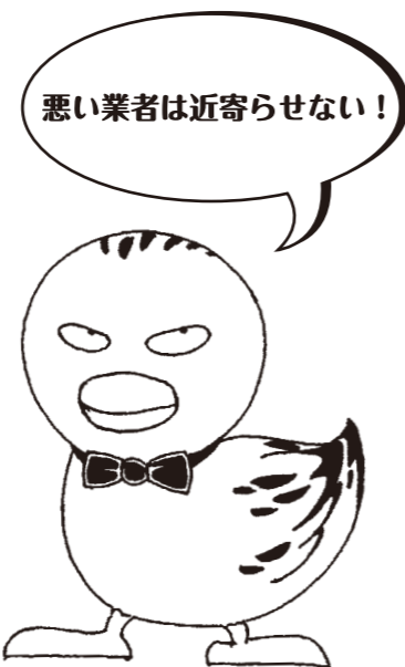
消費生活センターのキャラクター「正義の味方、ひっかからないカモ」