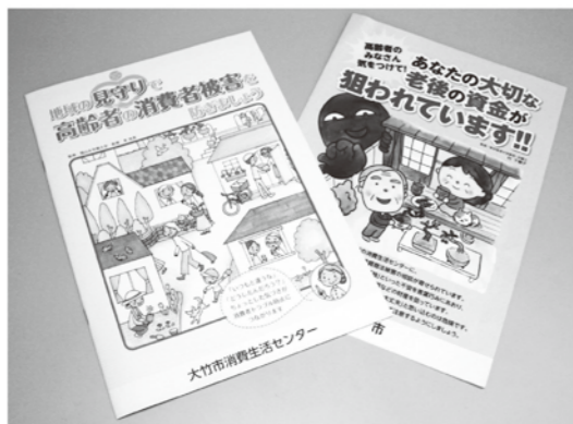
市消費生活センターでは、啓発パンフレットも配布しています。必要な方はご連絡ください。

【事例3】 「レアアース」を扱っているというA社の社債に関するパンフレットが届いた。その後B社から「A社の社債をほしがっている貿易商がいるが、案内が届いた人しか買えない。代わりに50口申し込んでほしい」と電話があった。「お金は貿易商が支払うので用意する必要はない。謝礼も払う。」とのことだった。申し込むだけで謝礼がもらえるならと申し込んだ。ところがA社から「監査が入り『名義人と振込人が違うのは問題だ』と指摘された。貿易商が帰国したら返すので代わりに入金してほしい」と言われ、200万円を振り込んだ。