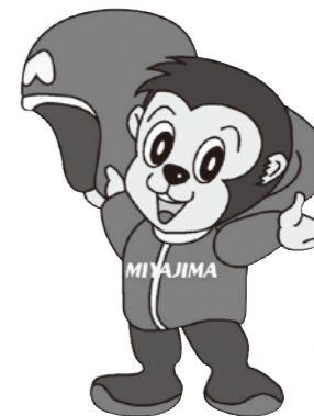
ボートレース宮島 マスコットキャラクター「モンタ」