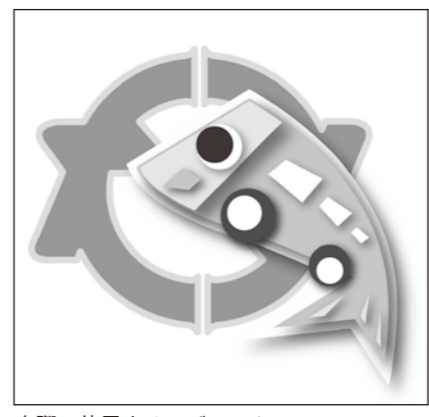
実際に使用するロゴマーク