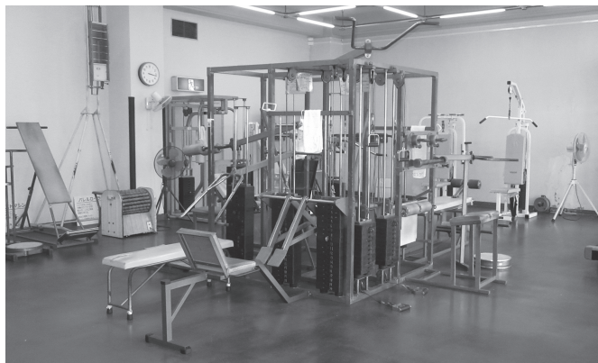
更新前のウエイトトレーニングマシン

スポーツくじtotoやBIGの収益は、日本のあらゆるスポーツに役立てられています。