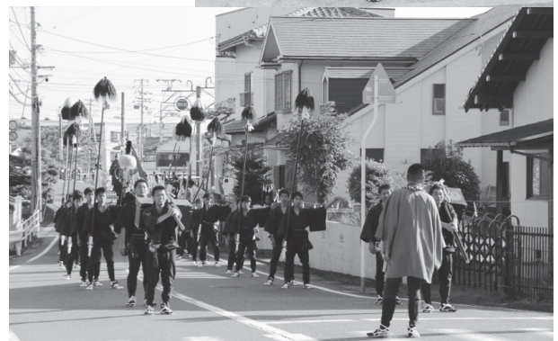
大名行列みたいだね♪