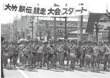
総合市民会館前を一齐にスタート

今年で61回目となる大竹駅伝競走大会が1月8日に開催され、過去最高となる122チーム、620人のランナーが大竹のまちを駆け抜けました。