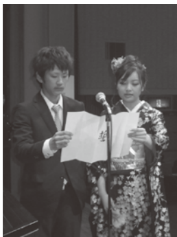
二十歳の誓いを宣言

成人の日の1月9日、二十歳の門出を祝う成人のつどいが開催されました。当日は216人が出席し、大人の仲間入りをした気持ちを改めて感じていました。