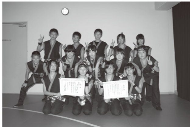
大竹一番太鼓ジュニア「童夢」

大竹一番太鼓ジュニア「童夢」が、10月2日に安芸高田市で開催された「けんみん文化祭ひろしま和太鼓の祭典小・中学生の部」において、最優秀賞を授賞しました。 また10月8日に広島県民文化センターで開催された「青少年育成県民運動推進大会」において青少年健全育成模範活動団体として県知事表彰を受けました。