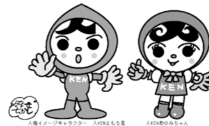
人権イメージキャラクター 人KENまもる君

などを配布しました。啓発物をきっかけに「人権」について考えていただければとの願いで実施しています。 また、保育所や幼稚園、小学校を訪問する活動も行っています。人権について考えたり、感じてもらうように人形劇や紙芝居を行ったり、人権の花を一緒に育てています。このような活動は、市内の保育所や幼稚園、小学校を順番に回っています。また、年によってはスポーツ人権教室を開催することもあります。