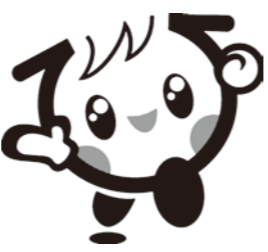
子ども元気いっぱい キャラクター イクちゃん